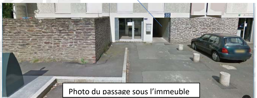
Photo du passage sous l'immeuble