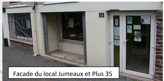
Facade du local Jumeaux et Plus 35