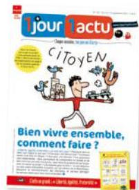
Illustration : Jacques Azam, Mascotte : Hélène Convert.